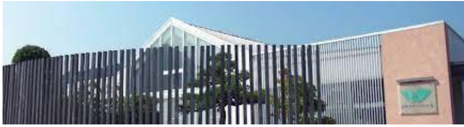
看護小規模多機能 令和4年3月オープン

この福祉事業を通じて、ロータリークラブの方針でもある「職業奉仕」を実践してゆきたいと思っておりますので、今後も皆様からのご指導をよろしくお願い申し上げます。