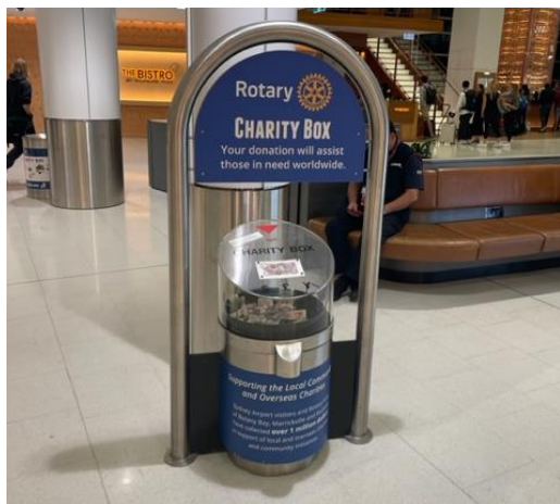
←空港にあった チャリティーボックス

友愛の家 諏訪PGのブースにて→ 折り鶴の折り方を教えて 欲しいと言われ、 私のパートナーが教えて あげていました。