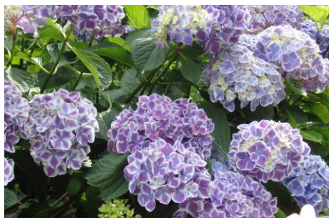
例会場のお隣にある三景園

登記申請に関し、AIからほぼ完璧なサポートを得て、本人が申請する時代がすぐそこまで来ています。私自身は、良い時代に生きれたことを感謝する今日この頃です。