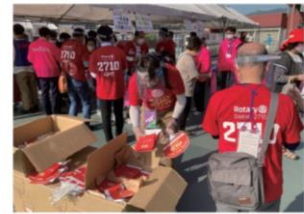
マツダスタジアム正面ゲート(ロータリー冊子とうちわの配布)