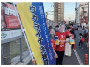
ウクライナ支援募金(カーブロード周辺)