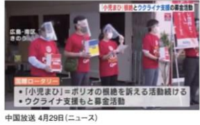
中国放送 4月29日(ニュース)