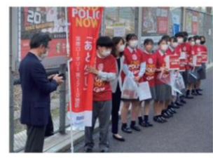
ポリオ根絶募金活動(インターアクト・カーブロード周辺)

開催日時 2022年4月28日(木) 14:30~19:00 募金活動場所 (7ヶ所) ●ローソン東荒神町店 ●日本通運広島支店 ●ウラシヤンス広島迎賓館 ●ベースボールファンベース広島勝継 ●中国銀行 広島東支店 ●大都販売 広島支店 ●赤ヘルツイン 公共イメージ調査場所 (2ヶ所) ●マツダ スタジアム正面入り口前テント ●マツダ スタジアム内 どうぶつ広場 参加人数 総登録数…323名(ロータリアン…196名、非ロータリアン…127名)