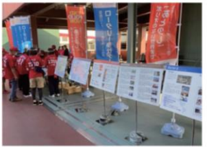
マツダスタジアムどうぶつ広場(公共イメージ調査)