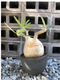
マダガスカルにある植物