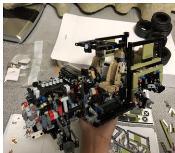
今、レゴで大きな車を作っています。