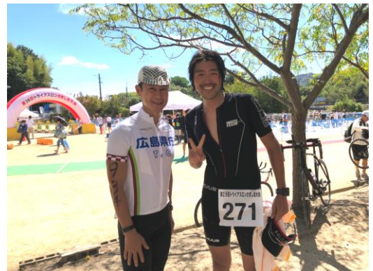
湯崎県知事との記念写真