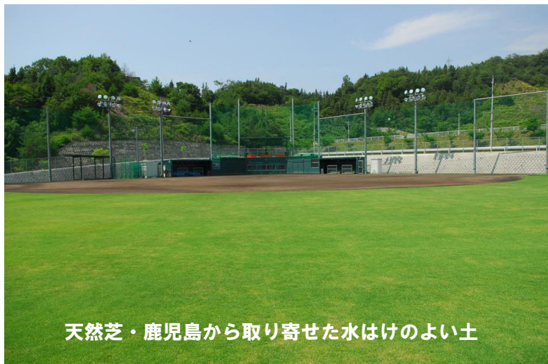
天然芝・鹿児島から取り寄せた水はけのよい土