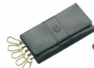
牛革5連キーケース 黒