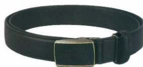
牛革公式ロゴベルト スライド式