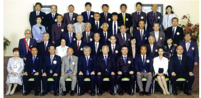
20日 第1回 お酒を楽しむ会(水軍の里)