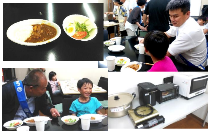
19日 竹原・広島空港 RC 初の合同公式訪問