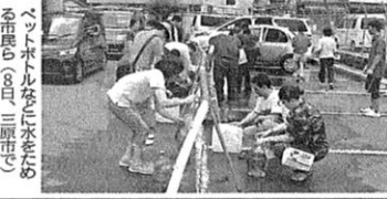
ベントホルをに水ためる市民(8日、三原市)

16日 大雨特別警報が出て10日たった三原市本郷町船木一帯。泥水が引き、水田には緑が戻ったように見える(午前11時54分) 7日 沼田川の氾濫で一帯が水に漬かった船木(午後0時46分)