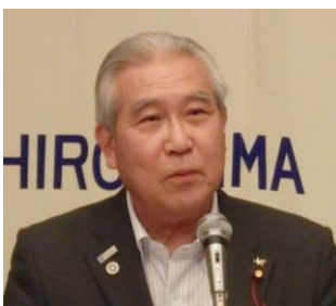
国際ロータリー第2710地区 G9 ガバナー補佐